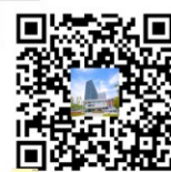
缴费教程视频二维码